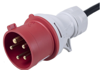
CEE 5pin 400 V