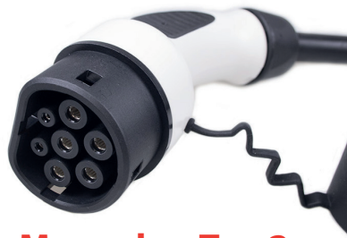
Mennekes Typ 2