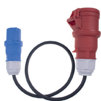
CEE 5pin 16A CEE 3pin 16A 230V 1m kempingová zásuvka