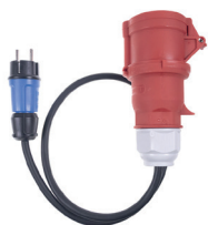
CEE 5pin 16A CZ SCHUKO 16A 230V 1m