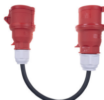
CEE 5pin 32A CEE 5pin 16A IP44