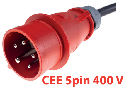
CEE 5pin 400 V